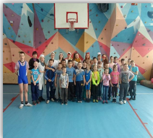
Участники спортивного праздника