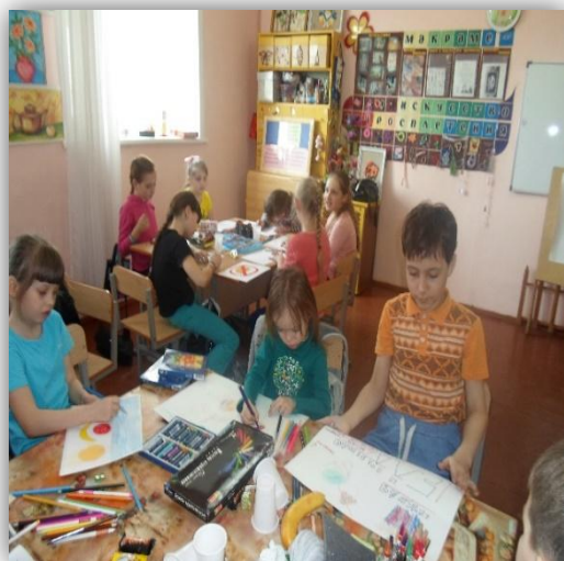
Подготовка к спортивному празднику