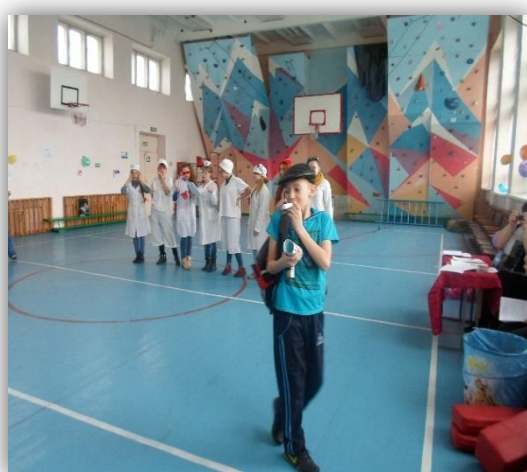
Сценка о вредных привычках