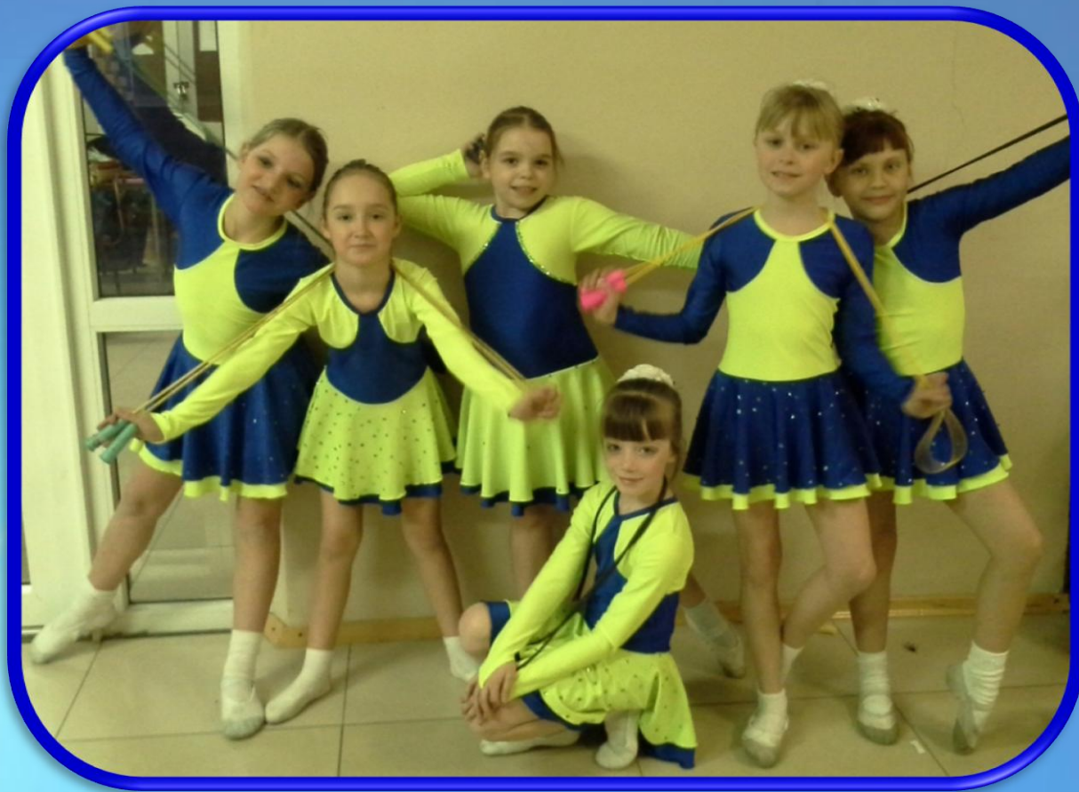
Хореографическая студия «Овация» (средняя группа)