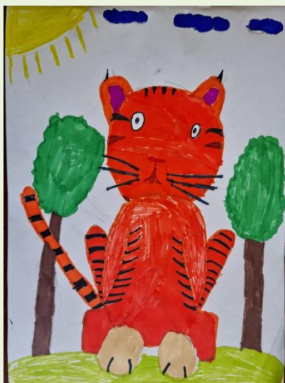
Работа Ефименко Петра