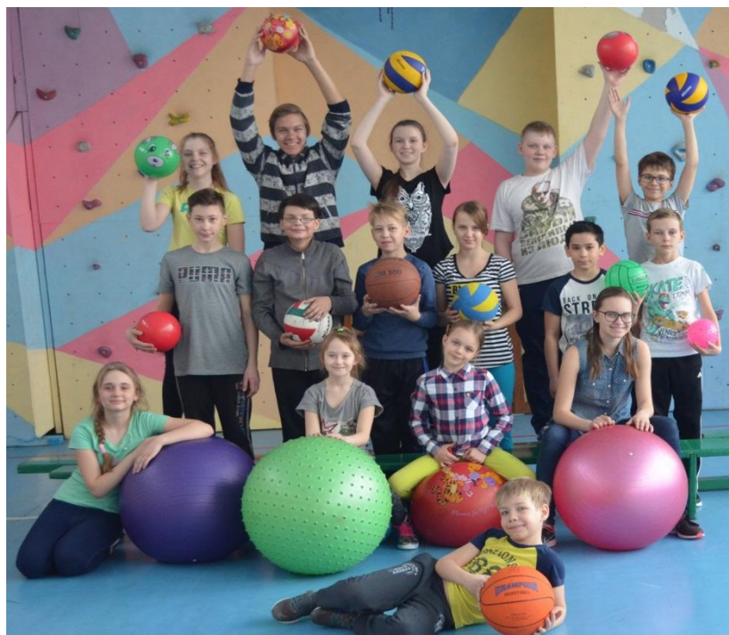
Участники спортивно-познавательного мероприятия «От мячика до мяча»