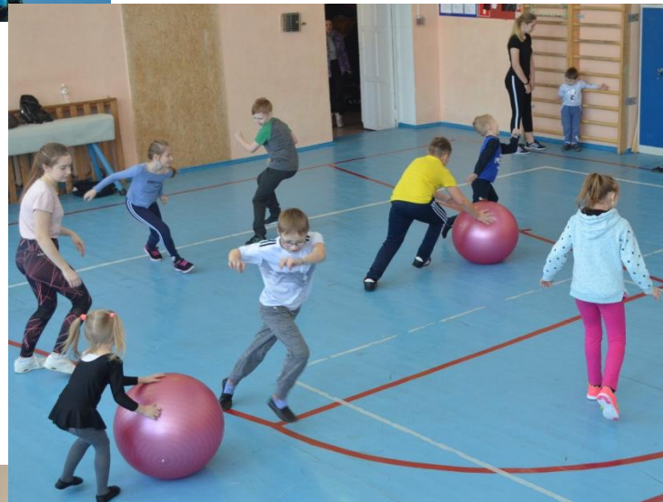
Игра «Снежный ком»