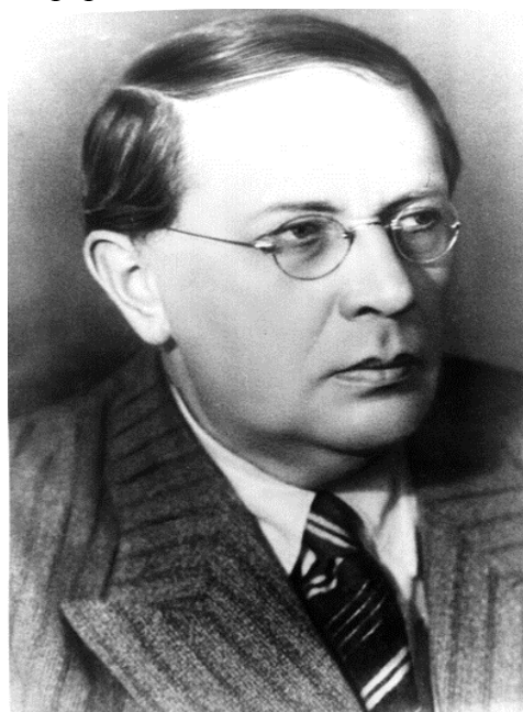
АЛЕКСЕЙ НИКОЛАЕВИЧ ТОЛСТОЙ