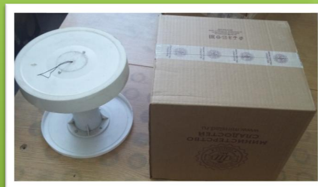
Пластмассовая катушка, картонная коробка