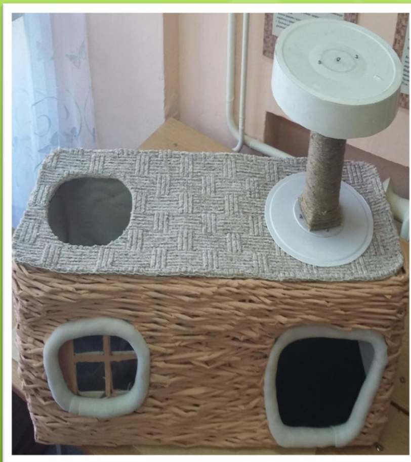
Когтеточка, соединенная к конструкции домика