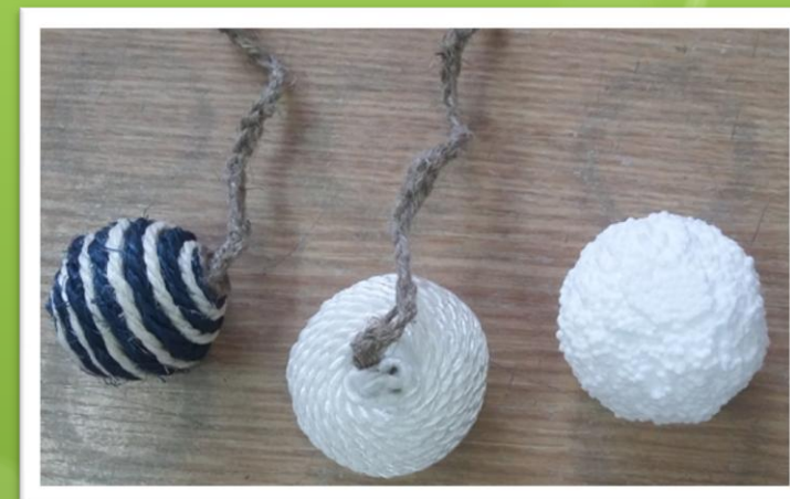
Готовые игрушки для кота