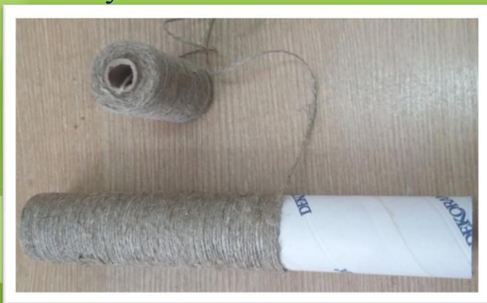
Пеньковая веревка, картонный цилиндр