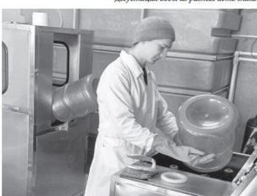
Производственный процесс фирмы «Ургал Аква»