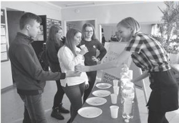
Декутация воды из разных источников